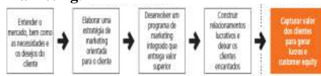
Figura 1 - Um modelo simples do processo de marketing.

A Figura 1 a seguir, apresenta um modelo simples de cinco etapas para o processo de marketing. Nas quatro primeiras etapas, as empresas trabalham para entender os consumidores, criar valor para o cliente e construir um forte relacionamento com ele. Na última etapa, elas colhem os frutos por criar valor superior para o cliente. Ao criar valor para os clientes, as empresas capturam valor dos clientes na forma de vendas, lucros e customer equity de longo prazo.