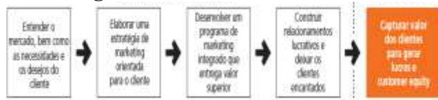
Figura 1 - Um modelo simples do processo de marketing.

para entender os consumidores, criar valor para o cliente e construir um forte relacionamento com ele. Na última etapa, elas colhem os frutos por criar valor superior para o cliente. Ao criar valor para os clientes, as empresas capturam valor dos clientes na forma de vendas, lucros e customer equity de longo prazo.