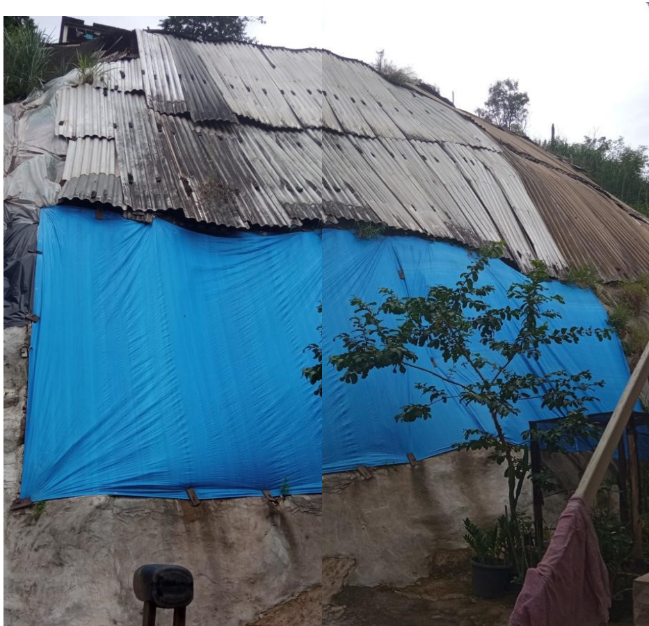
Foto 02 – Talude localizado na Rua Antônio Menezes (início da rua)