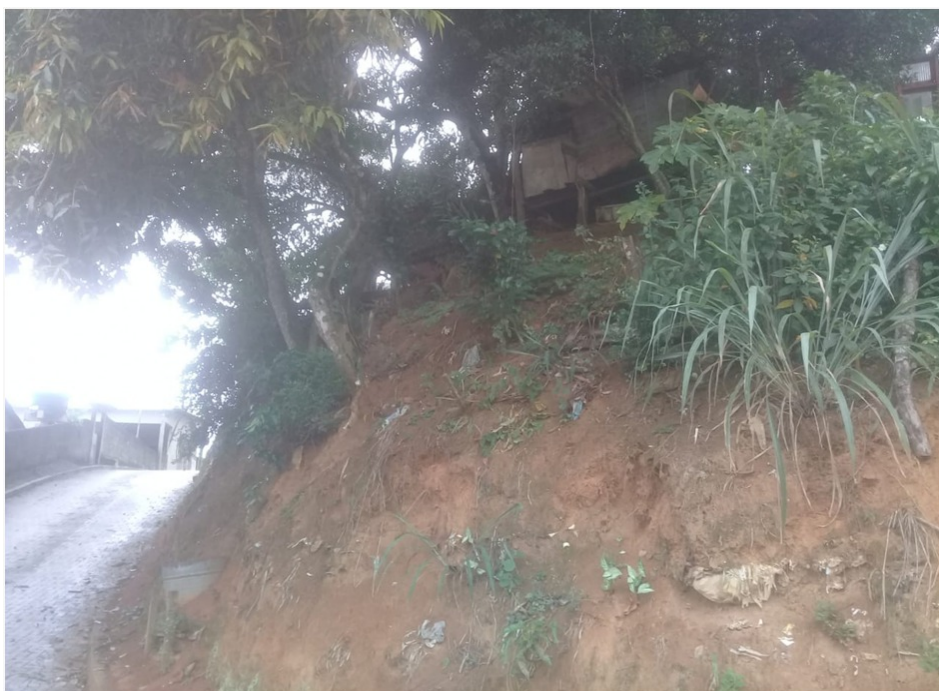
Foto 03 – Talude localizado na Rua Antônio Menezes (final da rua)