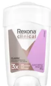
Desodorante Antitranspirante em Creme Rexona