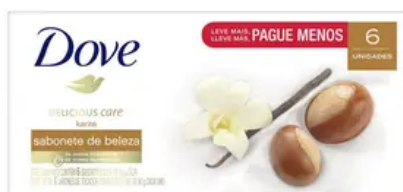
Sabonete Neutro Dove Delicious Care